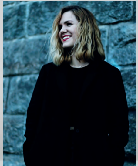
Liz Maaß, Illustration / Art